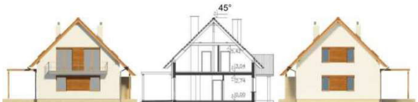
Abbildungen zeigen Sonderleistungen! Putzfarbe nach Farbskala